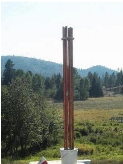
Orgonit Cloudbuster (hat Einfluss im Umkreis von 50 Km)