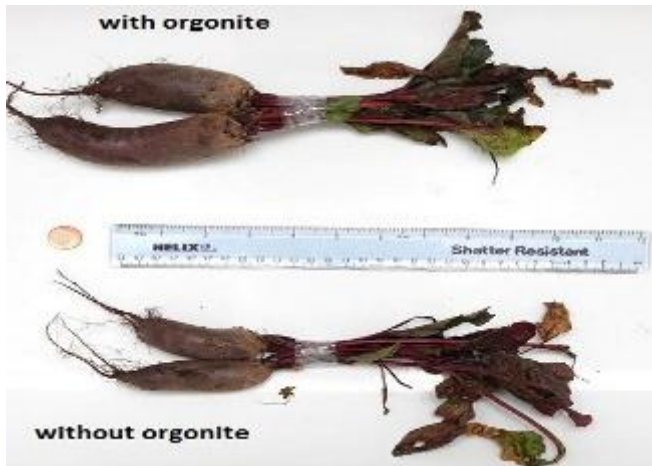
Gemüse mit und ohne Orgonit